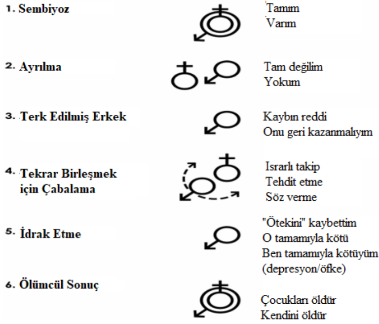
Şekil 3. Aile Cinayetlerinin Dinamiği (Sachman ve Johnson, 2014)'ten alıntılanmıştır.