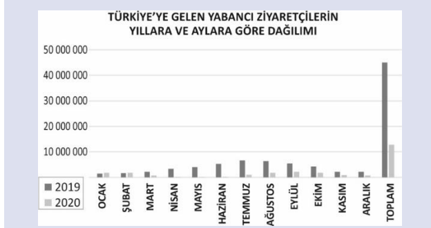
Şekil 2. 2019-2020 yıllarında yabancı ziyaretçilerin aylara göre dağılımı (Kültür ve Turizm Bakanlığı, 2020a)

Türkiye 2018 yılı genel değerlendirmede Dünya’da en çok turist ağırlayan 6. Ülke (45,8 milyon turist, uluslararası turizm gelirinde ise 15. Sırada (25,2 milyar dolar) bulunmaktadır. Türkiye 2019 yılında ise 51,8 milyon turist ağırlamış, 34,5 milyar dolar turizm geliri elde etmiştir (ktb.gov.tr). Türkiye’nin turizmde 2020 yılı hedefi 58 milyon