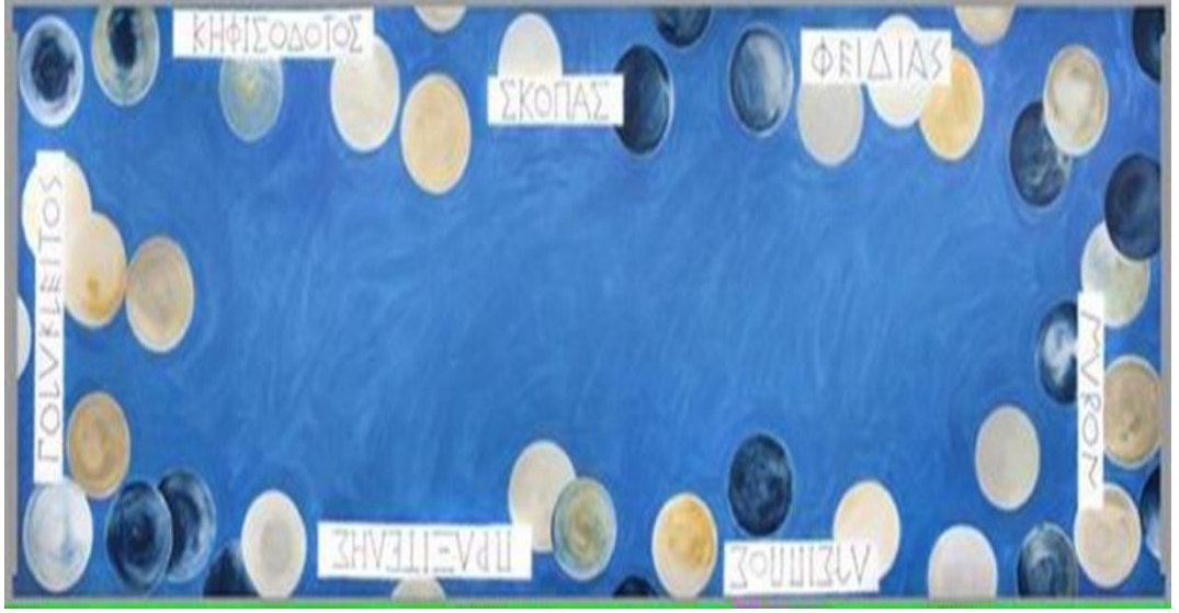
Resim 5: Cy Twombly, Louvre Müzesi, Bronz Eserler Galerisi Tavan Uygulaması.