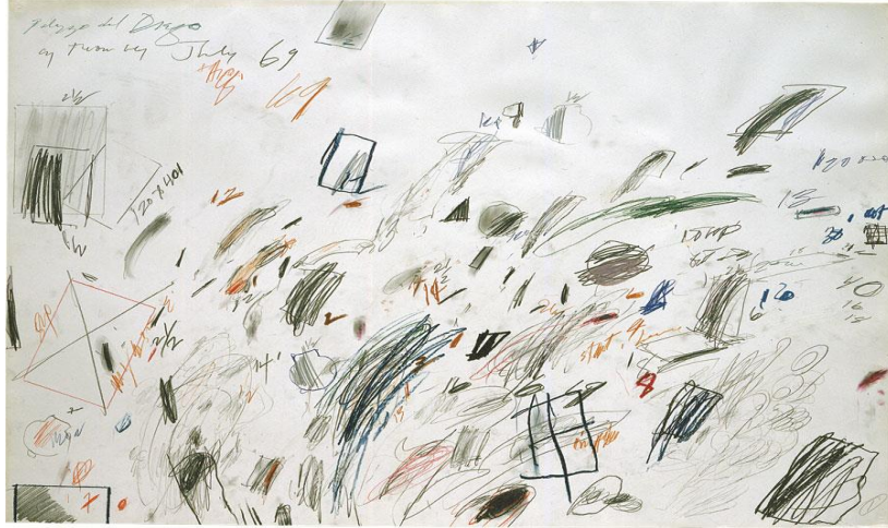
Resim 2: Cy Twombly, İsimsiz, 1969, kalem, balmumu, renkli kalemler, 73 × 102 cm.