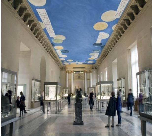
Resim 4: Louvre Müzesi, Bronz Eserler Galerisi