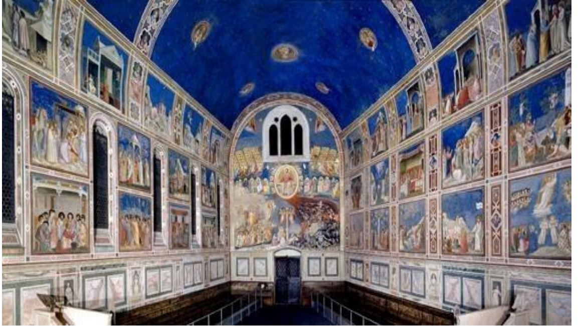
Resim 6: Giotto, Scrovegni Şapeli Freskleri, 14.yy başı.