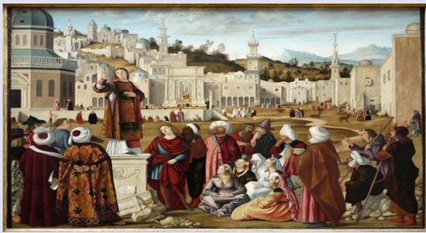
Görsel 4: Vittore Carpaccio, Aziz Stephen'in Vaazı, 1514, Louvre, Paris Figure 4: Vittore Carpaccio, St. Stephen's Sermon, 1514, Louvre, Paris

Carpaccio'ya ait diğer bir çalışma olan Aziz Stephen Vaazı (Fotoğraf 4), Scuola di Santo Stefano döngüsünde yer alır. Sanatçı bu eser üzerinde çalışmaya başladığında, figür, mimari ve kostüm detayları için epeyce bir Alman baskı eserleri biriktirmiştir. Ayrıca Erhard Reeuwich'in gravür illüstrasyonları, bu esere yansıyan en önemli kaynaklarından biri olmuştur. Bu parçanın mimari arka planı, doğrudan Reeuwich'in resimlerinden alınan birkaç binayı içermektedir. Ortada, Yakın Doğu'da hâlâ görülebilen ve bu bölgelere gelen Venedikli ziyaretçileri büyüleyen antik çağ kalıntılarında atıfta bulunan bir zafer takı ve Roma sütunu gösterilmektedir (Campbell, 1981: 467-73).