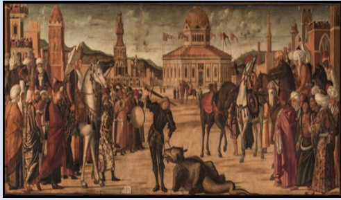
Görsel 1: Vittore Carpaccio, Aziz George'un Zaferi, 1507/8, Scuola di San Giorgio degli Schiavoni, Venedik Figure 1. Vittore Carpaccio, The Triumph of St. George, 1507/8, Scuola di San Giorgio degli Schiavoni, Venice

Dalmaçyalı tüccarların fondaco'su olan Scuola di San Giorgio degli Schiavoni, Aziz George Dalmaçya kardeşliğinin toplantı evi ve kendileri de bir haçlı örgütü olan Kudüs Aziz John Şövalyelerine ait bir binadır. Dalmaçyalılar, Adriyatik'te Türklere karşı Venedik mücadelesinin ön saflarında yer almışlardı ve Venedik'teki varlıkları, onları esasen Osmanlı genişlemesinden kaçan mülteciler olarak gösteriyordu. Toplantı odasını dekore etme komisyonunun vesilesi, Venedik bayrağı altındaki kahramanlıklarının onuruna Aziz George'un önemli konumunun vurgulanmasıydı. Dalmaçyalı tüccarların fondaco'su olan Scuola di San Giorgio degli Schiavoni'de, 1502 ile 1508 yılları arasında Vittore Carpaccio, dokuz resimden oluşan genel bir kompozisyonun parçası olarak Aziz George'un hayatından üç sahne yaptı. San Giovanni Evangelista'daki iki resim Venedik toplumunun çeşitliliğini temsil ederken, bu resimler Venedik sanatında alenen şark tarzının bir parçasını oluşturur. Bir bütün olarak anlatı, şehrin kuruluşunu ve refahını betimleyen tarihsel kroniklerin görsel bir karşılığı olarak, Venedik Efsanesi'ni temsil etme işlevi gördü (Brown, 1988: 254).