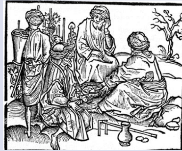
Görsel 2: Erhard Reeuwich, 1486, Suriyeli Şarap üreticileri, Los Angeles County Museum of Art Figure 2. Erhard Reeuwich, 1486, Syrian Winemakers, Los Angeles County Museum of Art

Venedik'te 15. yüzyılın sonlarında görülen siyasi gelişmeler, Vittore Carpaccio gibi sanatçıları eserlerinde bir mesaj verme sorumluluğuna yöneltmiştir. Osmanlı'nın ve İslam'ın genişlemesinin yarattığı korku, bazı Venedikli sanatçılar tarafından özellikle Hıristiyanlığa özgü kahramanlık hikâyelerinde karşıt imaj olarak ele alınmıştır. Carpaccio'nun Aziz George'un Zaferi eseri de bu örnekler arasında yer alır. Resmin solundaki birbirinden ayrı iki kule, Anastasis Kilisesi'nin kulesi ile cephesinden alınmadır. Klasik Rönesans mimarisine ait bir yapının önünde Aziz George'un zaferiyle sonuçlanan mücadele, Osmanlı kıyafetleri giymiş bir grubun ortasında gerçekleşmektedir. Doğuya özgü enstrümanlar çalan figürler ve atlılar, sahnenin yarattığı heyecanı teşvik etmektedirler. Diğer taraftan caminin resimdeki kubbesi, sivri olmaktan ziyade yarı küresel forma sahiptir. Resimdeki kıyafetler ise Reeuwich'in çizimleriyle benzeşir (Görsel 2-3).