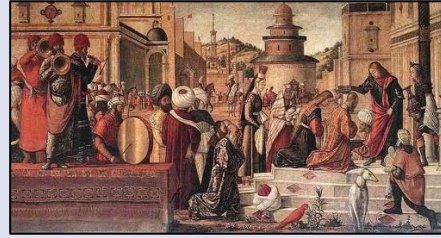
Görsel 5: Vittore Carpaccio, Selenitlerin Vaftizi 1507, Scuola di San Giorgio degli Schiavoni, Venedik Figure 5. Vittore Carpaccio, Baptism of the Selenites 1507, Scuola di San Giorgio degli Schiavoni, Venice

Aziz Stephen'in Vaazı isimli çalışmada etrafındaki kalabalığa vaaz veren genç Aziz, duruşuyla yıkık bir mermer kaide üzerinde yer alan bir Roma heykeline benzemektedir. Dinleyen kalabalıkta farklı etnik gruplar, gösterişli kıyafetler içinde temsil edilen Doğulularla beraber kadınlar ve erkekler görülür. Kalabalık arasında Hıristiyan hacılarıyla birlikte Osmanlı ve Memluk türbanlı erkekler de bulunmaktadır. Vaazın önünde, yerde oturan beş kadından dördünün peçelerinin geri çekildiği, yüzlerinin açığa çıktığı görülmektedir. Canlı arka plan; tamamı geleneksel Yakın Doğu kıyafetleri giymiş erkekler, kadınlar, çocuklar ve hayvanlardan oluşmaktadır. Böylelikle Osmanlıya özgü kıyafetler içinde resmedilen ve Müslüman oldukları anlaşılan bu insanlar, Aziz Stephen'in sözlerini dikkatle dinlerken; Hıristiyanlığın İslam üzerindeki hakimiyetine de vurgu yapmanın incelikli bir yolu gösterilmiş olur. Öte taraftan dinin birleştirici gücüne de evrensel bir katkı sunan bu yorumun, dinler arası diyaloga yapılan özgün bir vurgu olduğu söylenebilir. Zira Hıristiyan azizin sözlerinin, her iki dinin mensuplarını kapsadığı ve belli ki ortak bir mesaj içerdiği anlaşılmaktadır (Sgarbi, 1995: 97).