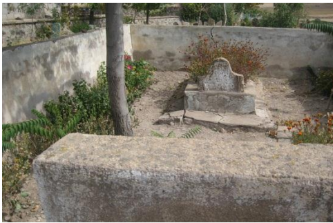
5. Şeyh Ümmî Türbesi/Yukarı Develi Köyü/Develi