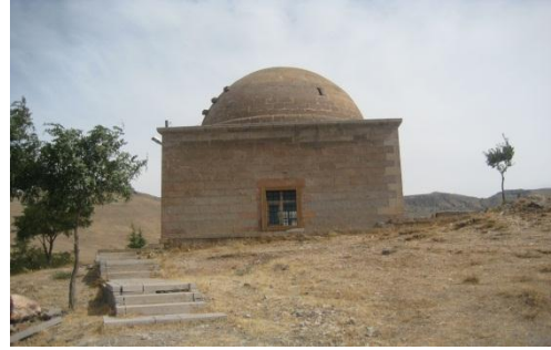
4. Seyyid İmâdeddîn Türbesi/Yukarı Develi