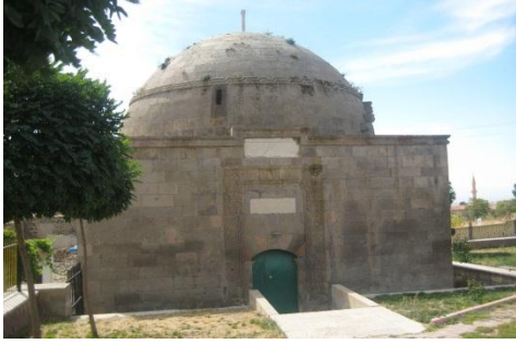
3. Seyyid Şerif Türbesi/Yukarı Develi