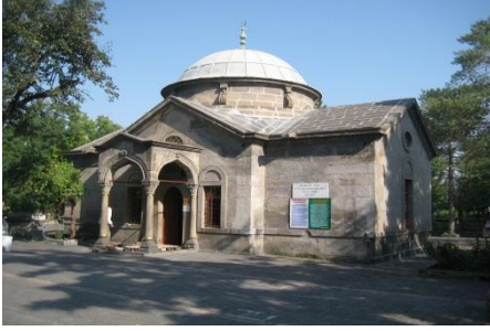
1. Seyyid Burhâneddîn Türbesi Kayseri Merkez