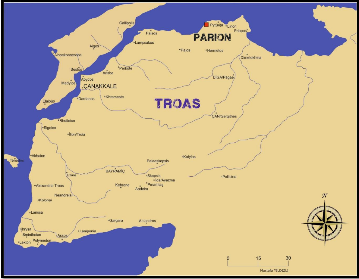
Harita 1: Parion ve Troas Bölgesi Antik Kentleri