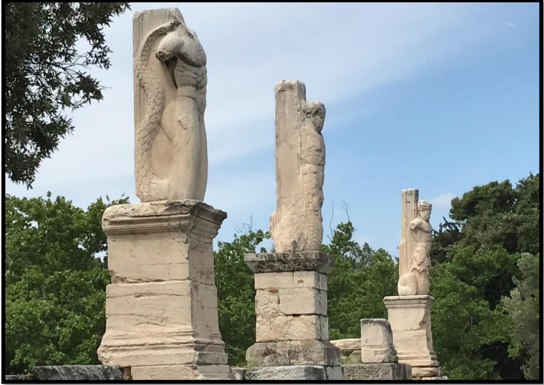
Resim 14: Didyma Apollon Tapınağı'nın sütun kaidesindeki Triton ve Nereid kabartması