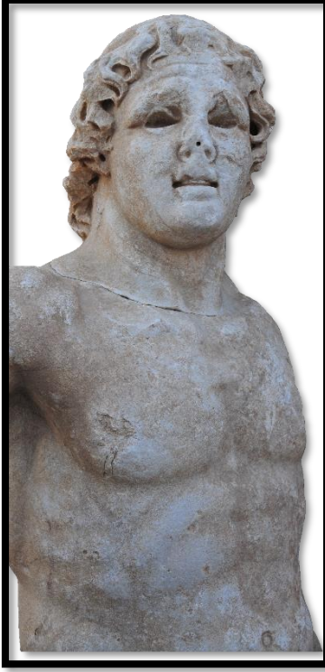
Resim 4: Triton Heykeli, saç ve göz detayı