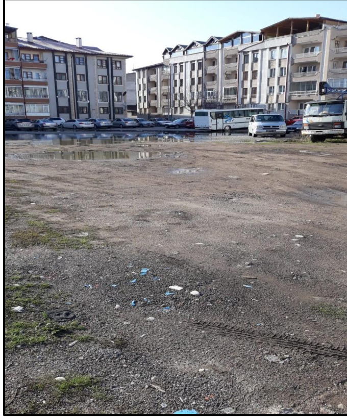
Resim. 2. Surp Kevork Kilisesi.