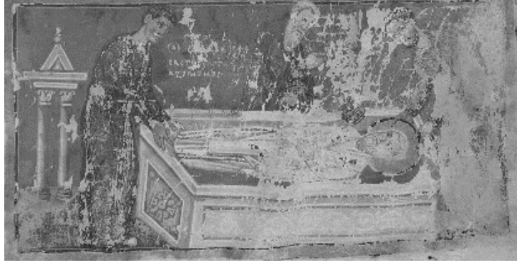
Resim 18. II. Basileios'un İmparatorluk Menologyası, W.521, folyo 36r, M.S. 11. yüzyıl, Kutsal ve Görkemli peygamber Micah'ın kefenlenip gömülüşü, Baltimore Walter Sanat Müzesi Arşivi (Ševčenko, 2013: II, 17, fig.12).