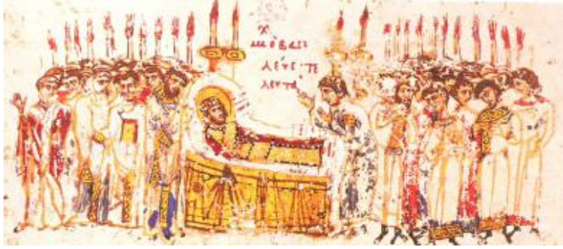
Resim 15: Kraliçe Anne Dondolo ölüm döşeğinde, Sopocani Manastırı, narteks kuzey duvarı 13. yüzyıl

( https://www.blagofund.org/Archives/Sopocani/Pictures/Narthex/Serbian_Medieval_Rulers:_Queen_Anna_Dandolo_and_St_Symeon_Nemania/Dormition_of_Queen_Anna_Dandolo_north_wall/ Erişim: 21.07.2020).