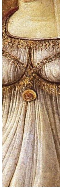
Resim 5. Sandro Botticelli, "İlkbahar" Resminden Ayrıntı