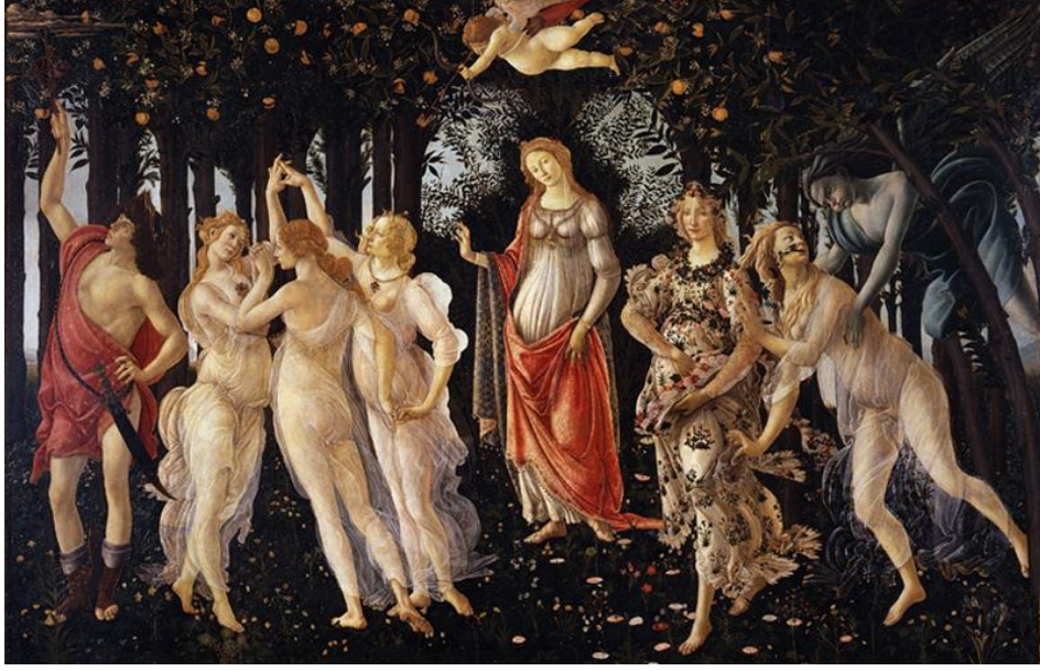
Resim 3. Sandro Botticelli, “İlkbahar”, Ahşap Üzerine Tempera, Ufizi Müzesi, Floransa, 1482