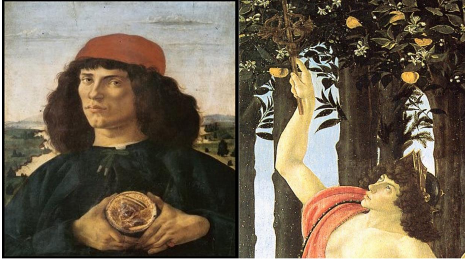
Resim 4. Sandro Botticelli, “Lorenzo II Magnifico’nun Madalyonlu Portresi” ve “İlkbahar” Resminden Ayrıntı (Merkür) Karşılaştırması