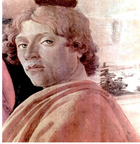
Resim 1. Sandro Botticelli, 1445-1510