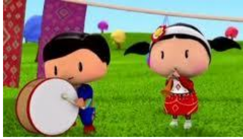
Resim 6: Pepee Şila ile halay için davul ve zurna çalarken ( http://www.pepeizle.net73Pepe-Halay-cekiyor.html ) (10. 12. 2012).