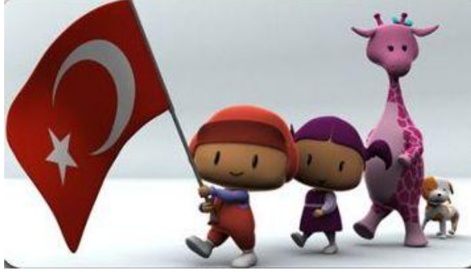
Resim 3: Önden arkaya Pepee, Şila, Zulu ve Köpüş. Pepee zaman zaman karşımıza elinde Türk bayrağı ile çıkmaktadır ( http://www.beyazgazete.comhaber20111118turk-pepee-aslinda-ispanyol-pocoyo-ymus.html ) (10. 12. 2012).