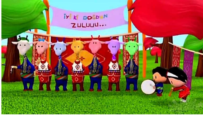
Resim 9: Pepee ve Şila, Zulu ve kardeşleriyle halk oyunu oynarken ( http://www.video-izlesen.net/dogum-gunu-pastasi-videolari-4 ) (10. 12. 2012).