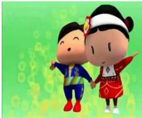
Resim 7: Pepee ve Şila halay çekerken ( http://www.dailymotion.comvideox9o7lv_asalaya-tepki-icin-kendini-yakan-er_news ) (05. 01. 2012).