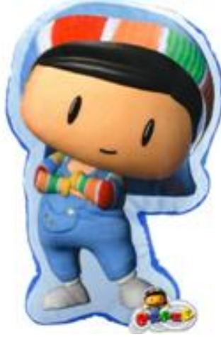
Resim 1: Pepee çizgi filminin ana karakteri Pepee ( http://www.tvdenal.com385-pepee-figur-pelu-yastik-46-cm.html ) (10. 12. 2012)