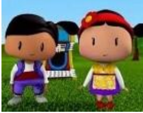
Resim 8: Pepee ve Şila yöresel halk oyunları kıyafetleri ile ( http://www.starkizoyunlari.commakyaj-oyunlarioncesi-ve-sonrasi.html ) (05. 01. 2012)