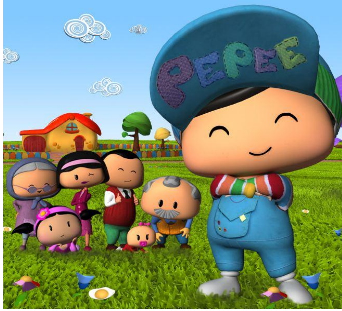
Resim 4: Pepee ve ailesi. Soldan sağa Pepee, dedesi, Bebe, babası, annesi, Şila ve nenesi ( http://imageri.com/item/photos/139/GNXUK9XSW6D9/pepee-ve-ailesi ) (10. 12. 2012)