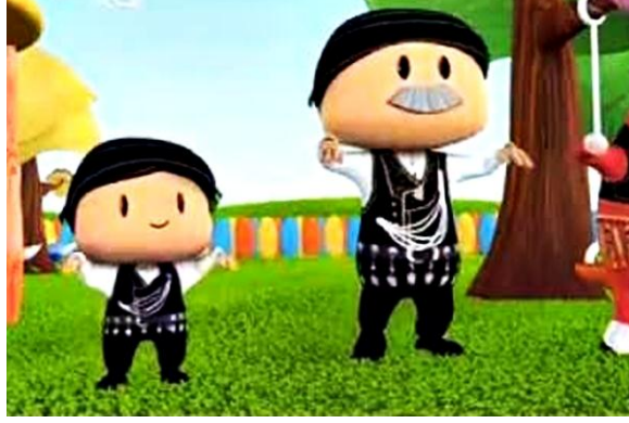
Resim 5: Pepee dedesi ile horon teperken ( http://www.resim2.compepee-resimlerikarateci-pepee.html Tepiyor) (10. 01. 2012).